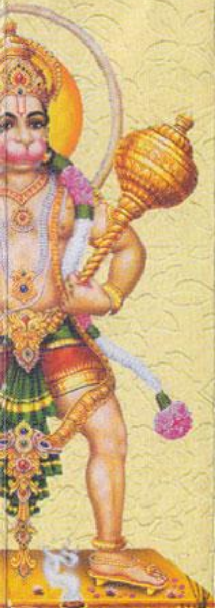
అదుగుల అధ్యయన వీరచానుమాన్ విగ్రహము